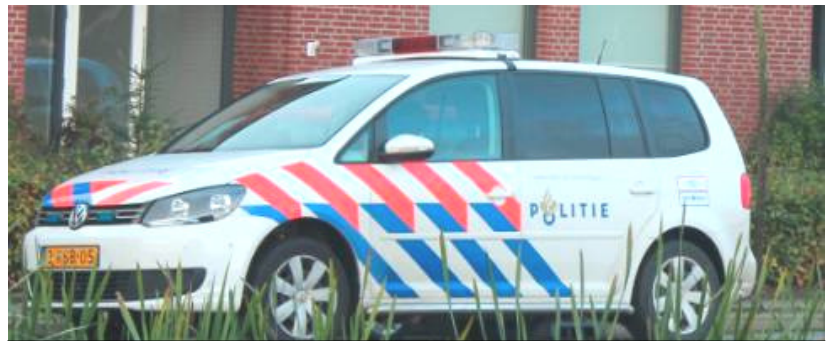
Politie aan het werk in Nieuwerkerk aan den IJssel