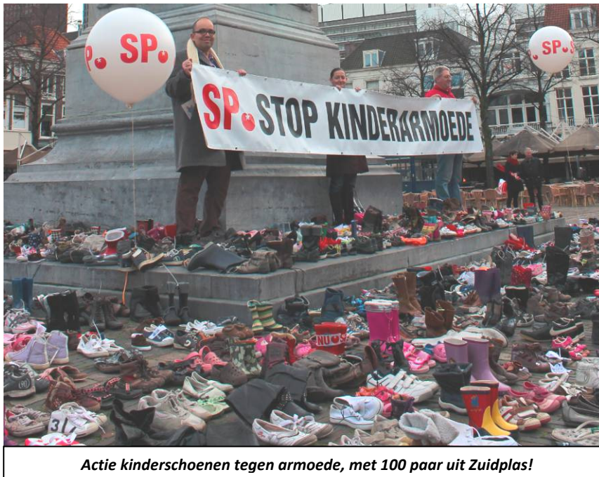
Actie kinderschoenen tegen armoede, met 100 paar uit Zuidplas!