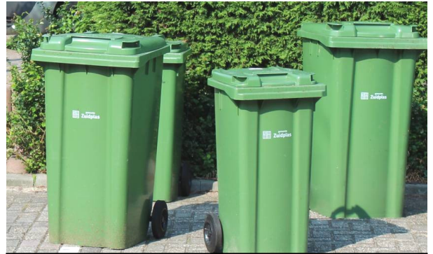
GFT containers in Zuidplas

De eerste vier jaar van nieuwe gemeente Zuidplas waren geen toonbeeld van duurzaamheid. Dat is jammer, want een nieuwe gemeente kan hier een goede start in maken en ook laten zien dat duurzaamheid niet alleen een kostenpost is. Ook SP heeft veel aandacht gevraagd voor normale duurzame oplossingen. Daar gaan we mee door om tot de groenste gemeenten van Nederland te gaan horen.