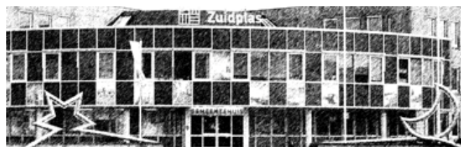
Gemeentehuis Zuidplas een ivoren toren?

Als één iets de inwoners heeft geraakt is het wel de gevolgen van de fusie. Uit het inwonersonderzoek in 2013 bleek aardig wat onvrede op sommige gebieden. Het is dan ook belangrijk dat we gaan inzien dat bewoners betrokken moeten blijven. De SP denkt dat dit