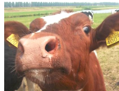
Koe in Moordrecht, buiten zoals het hoort!