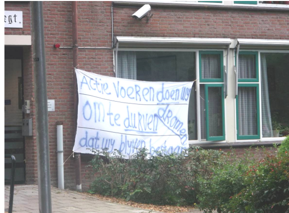
Vertrek Moerdregt uit Moordrecht is een Aderlating voor het dorp