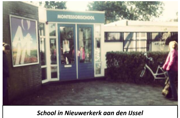
School in Nieuwerkerk aan den IJssel

Elk kind heeft recht op onderwijs, gratis basisonderwijs en op passend voortgezet onderwijs. Een kind moet onderwijs kunnen volgen waartoe bij zijn identiteit past. De overheid is hier degene die voorwaarden moet scheppen om dit mogelijk te maken. De SP is voorstander van brede scholen maar in tijden van bezuinigingen moet je je wel afvragen of dit tegen elke prijs moet. Het voortgezet